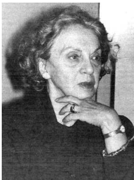
Sophia de Mello Breyner